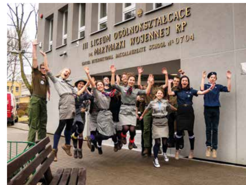
Harcerze przed wejściem do III LO, 2017

2011-2018 | bez danych z trzech szkół IBO, które odmówiły ich udostępnienia