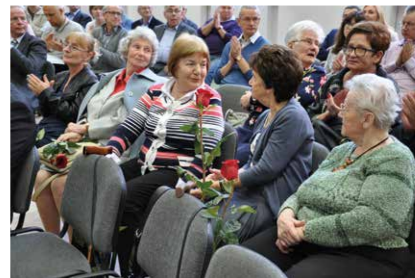
Dzień Edukacji Narodowej, październik 2018