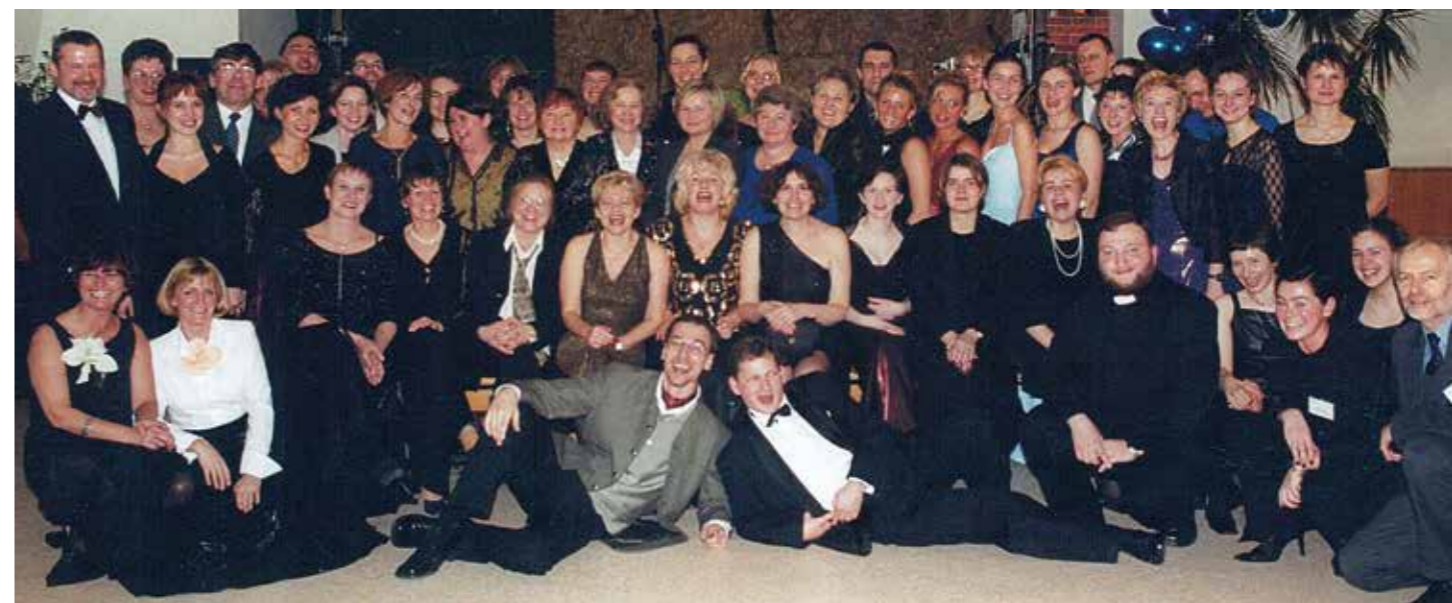
Przed rozpoczęciem kolejnego balu szkolnego, początek XX wieku