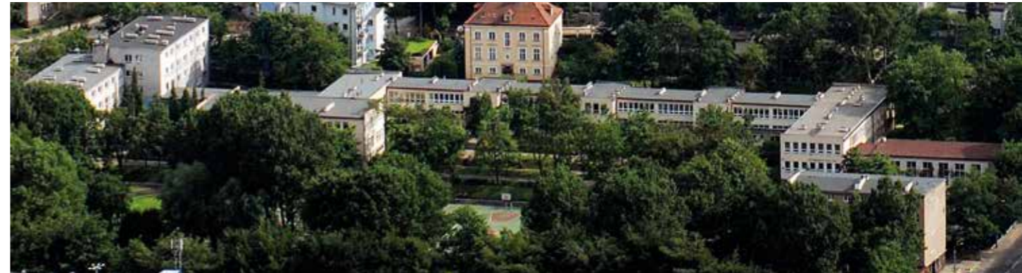
Północny stok Kępy Redłowskiej, budynek III LO, lipiec 2007

Niewątpliwie istotą oferty edukacyjnej III LO w Gdyni jest jego kadra pedagogiczna. Znakomici, wyjątkowi nauczyciele mistrzowie przyciągają do szkoły wyjątkowych uczniów, bez względu na to, jak daleko mieszkają od szkoły i z jakich środowisk społeczno-kulturowych się wywodzą. Właśnie taka jest kadra, która pracowała w Trójce niegdyś i pracuje dzisiaj.