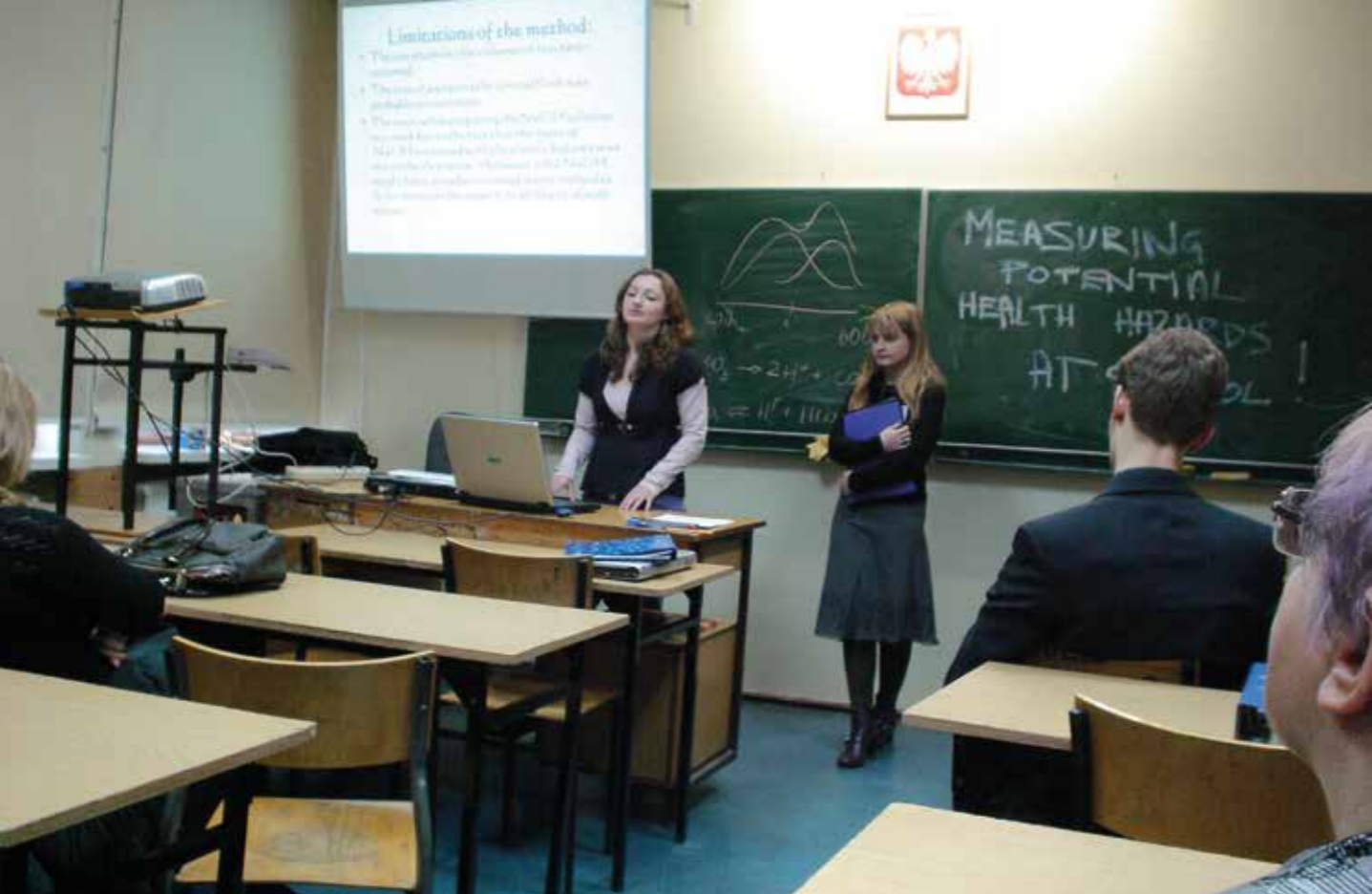
Prezentacja podczas lekcji fizyki w klasie IB-DP