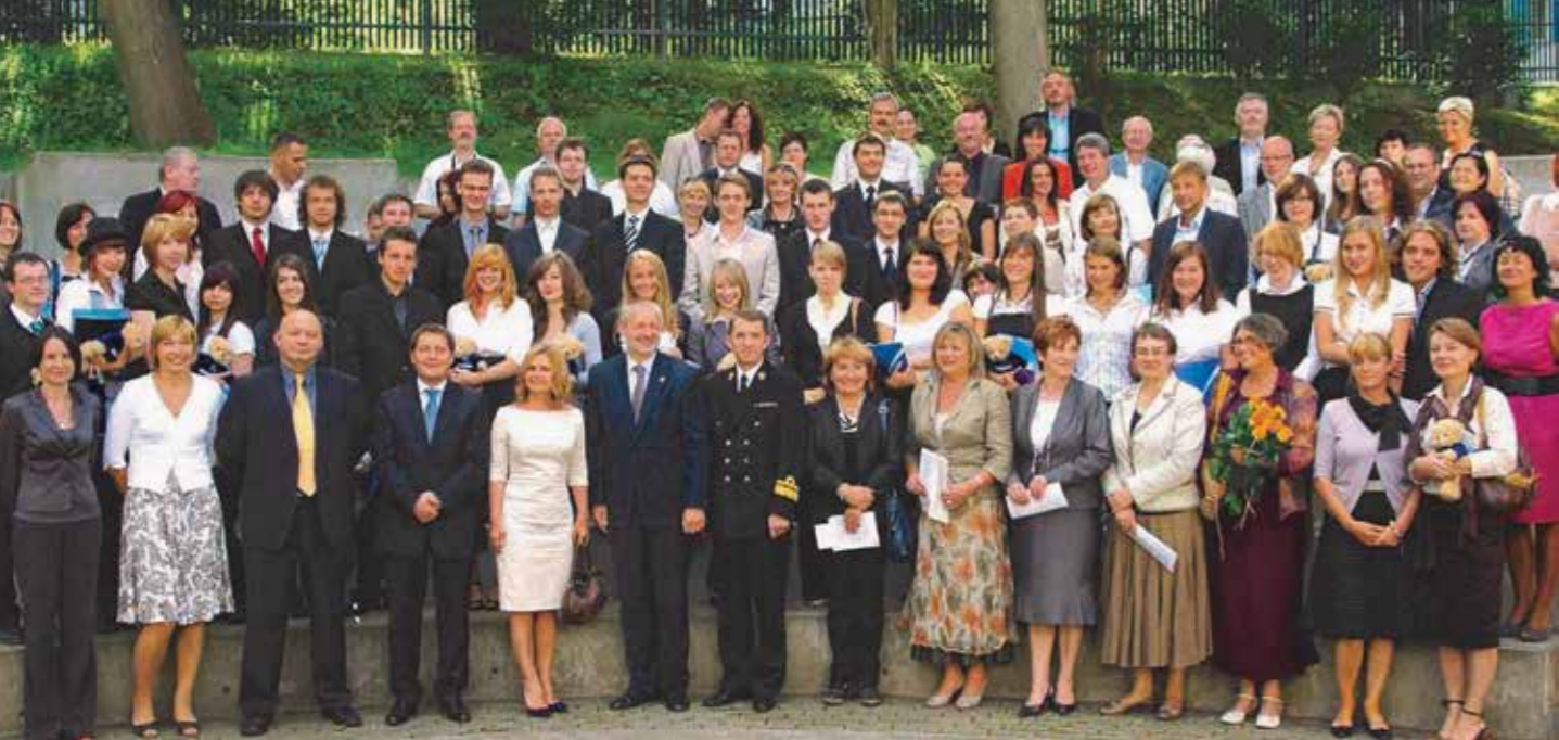
Pamiętkowa fotografia w amfiteatrze szkoły po uroczystości wręczenia dyplomów IB, wrzesień 2011