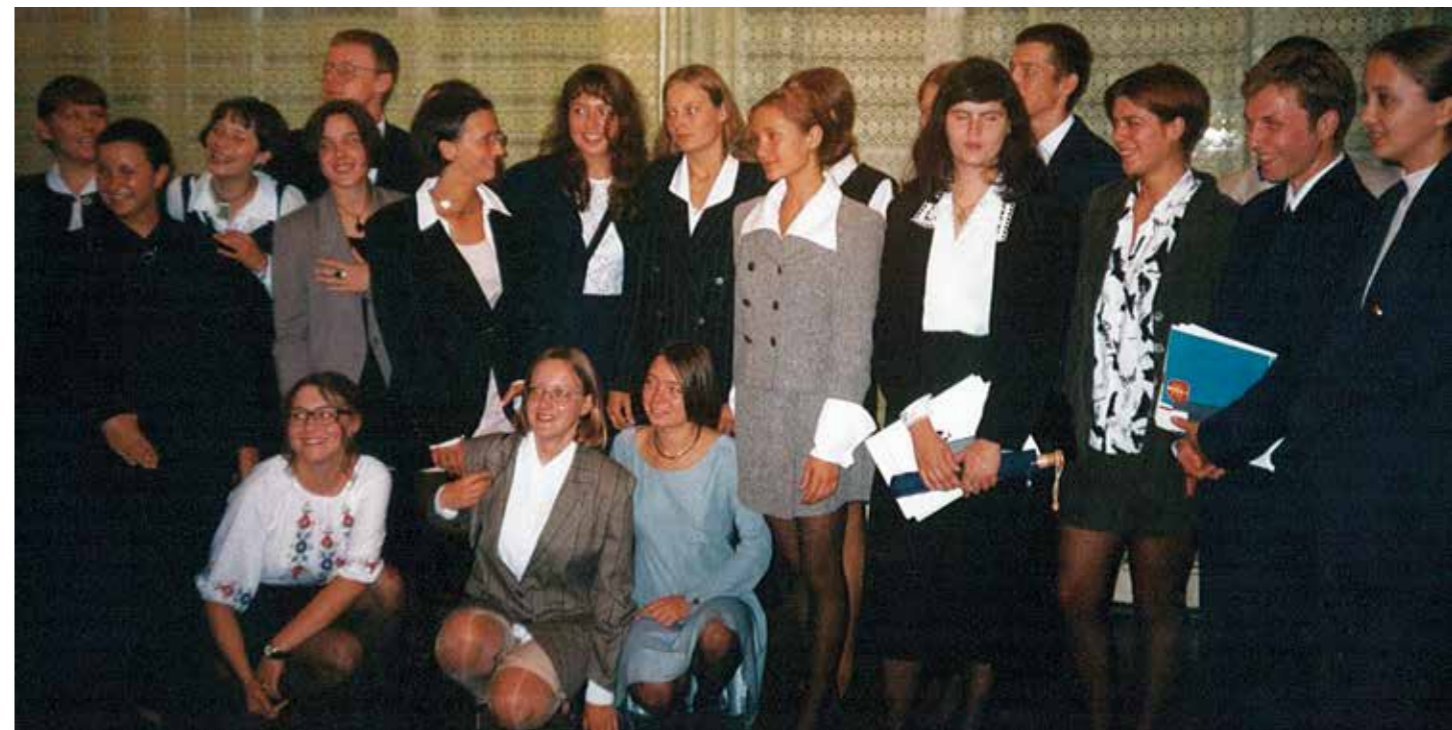
Klasa IB, rocznik 1993–1995

Pierwsza w historii matura międzynarodowa przeprowadzona w polskiej szkole była zwieńczeniem kilkunastoletnich (XXXIII LO w Warszawie) lub kilkuletnich (III LO w Gdyni) zabiegów grupy pedagogów zapaleńców. Stała się też zapowiedzią przyszłej nowej polskiej matury. Doświadczenia nauczycieli oraz dyrektorów liceów z maturą międzynarodową w zakresie merytorycznego i organizacyjnego przygotowania sprawdzanego zewnątrz egzaminu maturalnego okazały się niezwykle cenne w okresie przygotowywania, pod koniec lat 90. ubiegłego