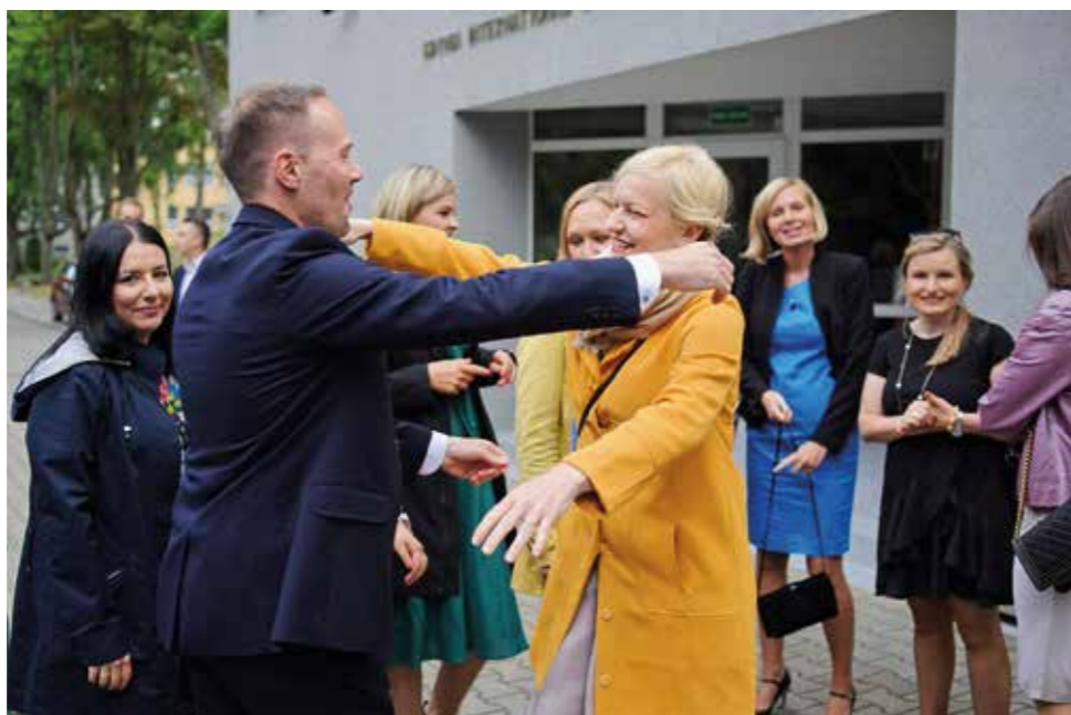
Spotkanie po 20 latach, maturzyści 1998, 23 czerwca 2018

miało problemy z pisaniem prac naukowych, nawet tak proste rzeczy jak używanie bibliografii – trzeba było się ich nauczyć i na kolejnych etapach edukacji one nie sprawiały mi już problemu.