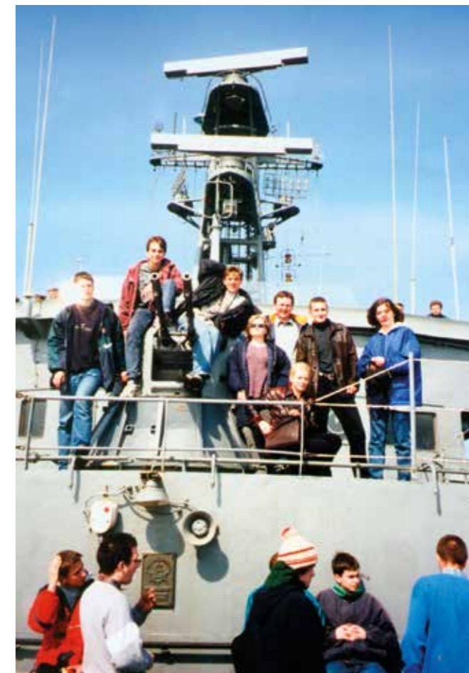
Wizyta na okręcie RP