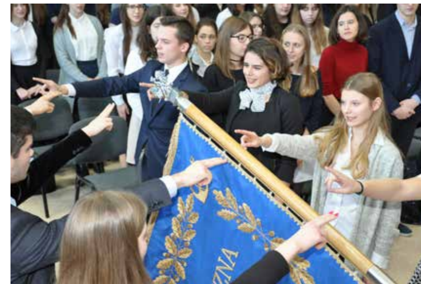
Ślubowanie klas pierwszych w DNIU PATRONA SZKOŁY 28 listopada 2017

Na cześć patrona Święto Szkoły obchodzone jest 28 listopada, na wspomnienie 1918 roku, gdy naczelnik państwa polskiego marszałek Józef Piłsudski podpisał dekret o utworzeniu Marynarki Wojennej. Liceum wraz z Marynarką Wojenną zrealizowało wiele wyjątkowych edukacyjnych przedsięwzięć, m.in.: V Międzynarodową Olimpiadę Geograficzną (2004), Światowy Zjazd Absolwentów III LO z okazji 50-lecia utworzenia szkoły (2000), cztery finały ogólnopolskie olimpiady geograficznej i nautologicznej, liczne bale charytatywne na rzecz uczniów szkoły, szkolenia z zakresu obrony cywilnej i nawigacji. Uczniowie z sukcesami biorą udział w konkursach, w których wymagana jest m.in. wiedza z zakresu historii i obecnych dokonań patrona. Cała społeczność gdyńskiej Trójki kwestowała na rzecz budowy obecnej siedziby Muzeum Marynarki Wojennej w Gdyni. 55-letnią tradycją są wzajemne wizyty przedstawicieli liceum i jego patrona z okazji ważnych wydarzeń szkolnych i wojskowych. Wielu obecnych i byłych oficerów Marynarki Wojennej oraz pracowników naukowych i absolwentów Akademii Marynarki Wojennej w Gdyni ukończyło III LO.