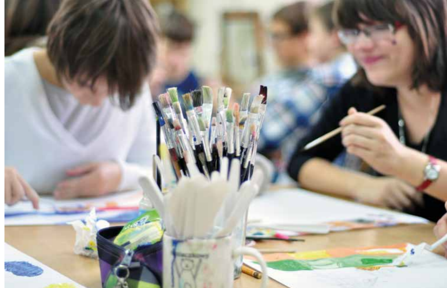
Zajęcia z visual arts w klasie IBO-MYP

przysługuje w strukturze IBO oznaczenie numerem kodowym 000704, czyli z pierwszeństwem numeru kodowego z 1993 roku.