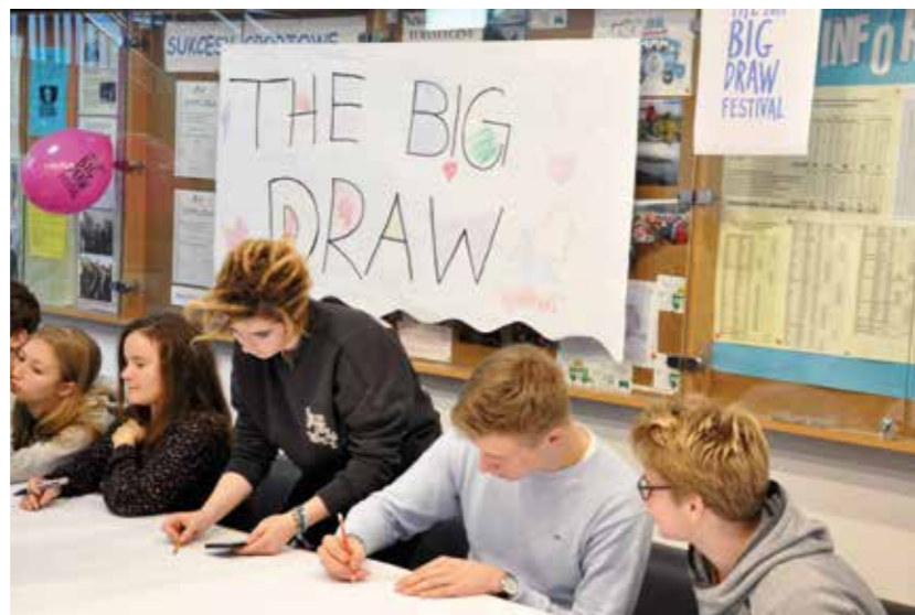
Stoiska uczniów podczas prezentacji PERSONAL PROJECT w ramach nauki w klasach IBO-MYP, marzec 2017