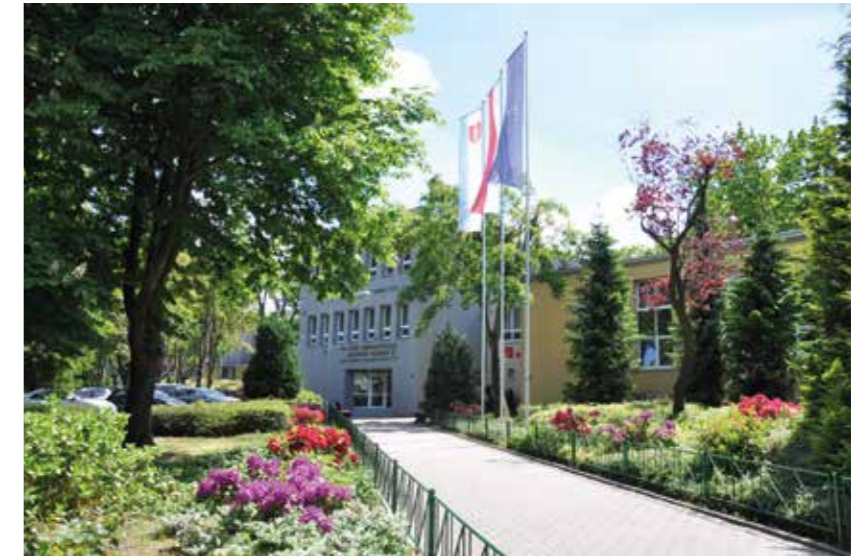
Wejście do szkoły od strony ul. Legionów