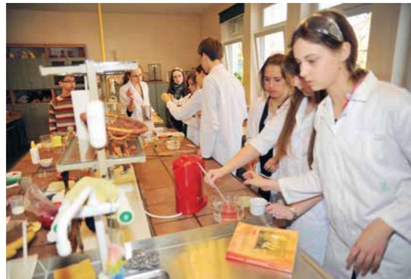
Zajęcia genetyki podczas lekcji biologii

niu znacznie większej niż 24 liczby punktów matura IBO uznawana jest za niezdaną. Dyplomu IBO nie otrzyma uczniów, który nie wywiązał się z obowiązków wynikających z uczestnictwa w programie CAS (ang. creativity, action, service), czyli pracy społecznej na rzecz szeroko rozumianego środowiska społecznego i przyrodniczego (liczba punktów za egzamin nie ma w tym przypadku żadnego znaczenia).