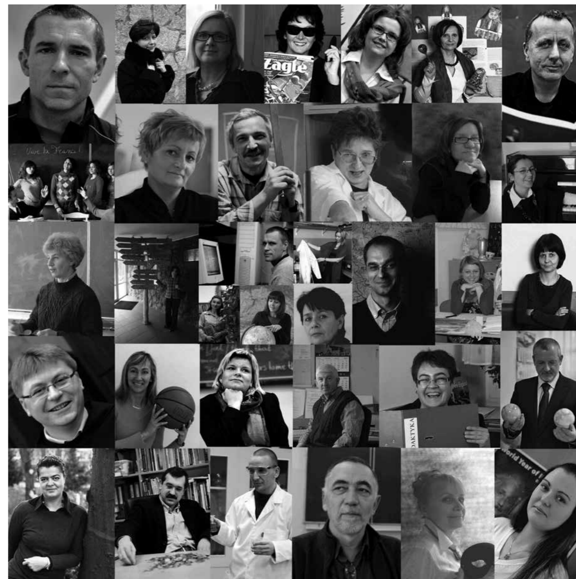
Kadra pedagogiczna i administracyjna III LO