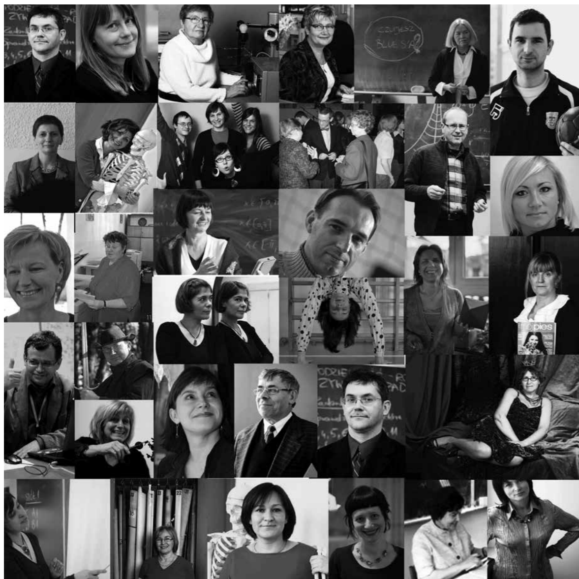
Kadra pedagogiczna i administracyjna III LO